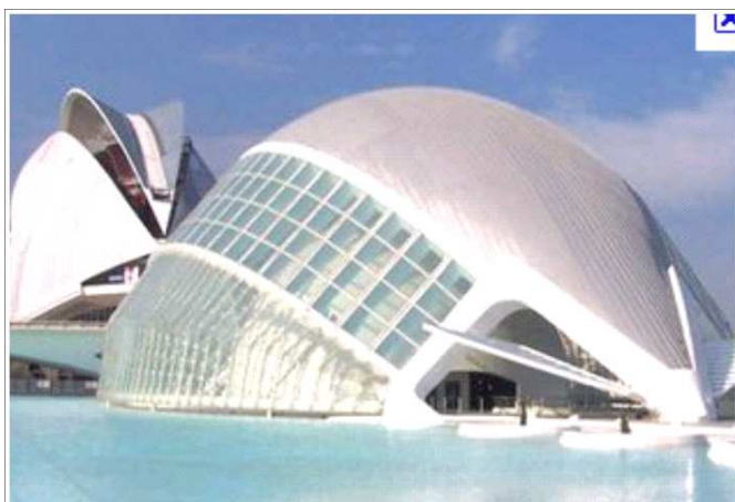
Hemisferio y Museo de las Ciencias en la nueva Ciudad de las Artes y las Ciencias de Valencia, proyectada por Santiago Caltrava.