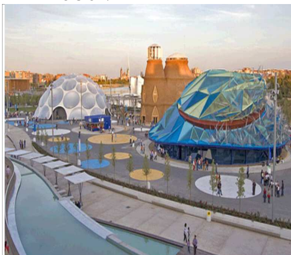
Exposición Universal sobre el Agua. Zaragoza. 2008

En los últimos tiempos, las ciudades han sido pasto de la especulación urbana. Se denomina burbuja inmobiliaria a la tendencia a comprar terreno y edificios como inversión y no para ocuparlos realmente. Gran parte de la construcción en España no se ha vinculado a la demanda real de vivienda, sino a la demanda del mercado de inversión.