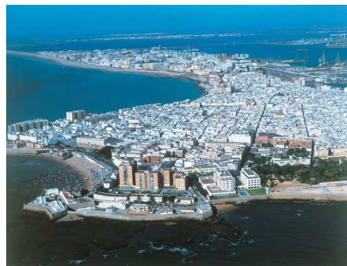
Cádiz: emplazado en la bahía