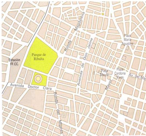
Plano ortogonal (Castellón de la Plana).

d) La construcción incluye la trama urbana y la edificación. La trama es la disposición de los edificios. Puede ser compacta o cerrada (cuando los edificios se disponen unos junto a otros a lo largo de grandes extensiones), o abierta (cuando dejan amplios espacios libres entre sí).