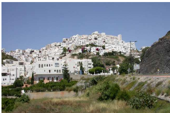
Mojácar (Almería) sobre un cerro